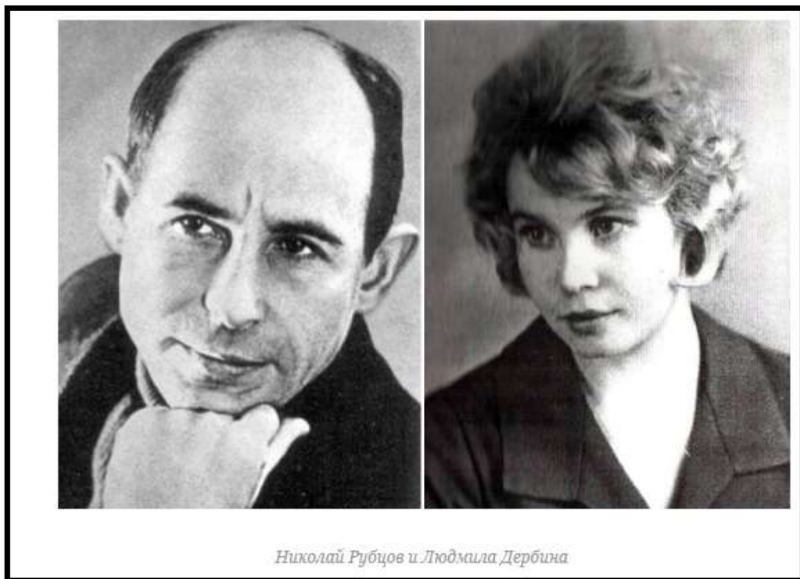
Николай Рубцов и Людмила Дербина

Людмила влюбилась в поэзию Николая Рубцова и поняла, что её место рядом с ним.